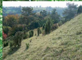
Wacholderheide im Altenburger Bachtal