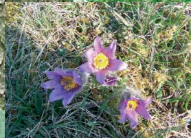
Viele seltene Tier- und Pflanzenarten, wie hier die Küchenschelle, gehören zu den Attraktionen im Naturschutzgebiet „Schönecker Schweiz“

Wandern Sie in ruhiger, ungestörter Natur. Festes Schuhwerk, Getränke und Verpflegung für unterwegs sollten Sie nicht vergessen, denn Einkehr-Möglichkeiten bestehen nur in Schönecken selbst.