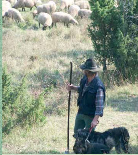
Schafbeweidung dient dem Erhalt der artenreichen Magerrasen.

Naher der Burg findet man auf den flachgründigen, kalkreichen Böden der Südhänge um Schönecken Halbtrockenrasen mit einer reichhaltigen Tier- und Pflanzenwelt. Wandert man in die Täler von Schalken- oder Altburger Bach hinein, dann dominieren Wälder – allen voran frische Buchenwälder – das Bild der Landschaft, oft durchsetzt von eindrucksvollen Felsbildungen.