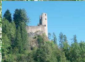
Malerisch thront die im 13. Jahrhundert erbaute Burg Schönecken über dem Tal der Nims. Sie hat eine bewegte Geschichte hinter sich.