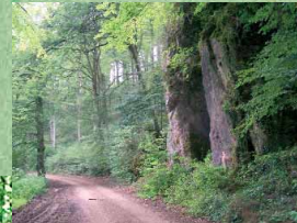
Bizarre Felsformationen, wie hier an der Jungfrauley, laden zum Wandern ein.

Herrliche Buchenwälder, Felsen, reizvolle Blicke in die vielfältige Landschaft um Schönecken. Dies und mehr bieten Ihnen die umseitig dargestellten Wege auf und um Route 2 der Prümer Land Tour. An einigen Stellen können Sie durch Infotafeln näheres zu Eigenheiten und Geschichte dieser Landschaft erfahren.